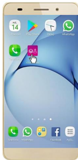
Figura 6. Pantalla con el icono instalado de la App.