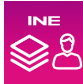
Figura 5. Imagen de la App.

Para hacer uso de la Aplicación Móvil deberás cerciorarte que está instalada previamente en tu dispositivo móvil, esta App será identificada como Apoyo Ciudadano - INE .