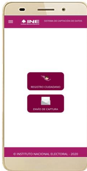
Figura 11. Menú principal Registro Ciudadano