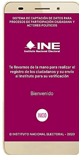
Figura 7. Pantalla de Bienvenida.