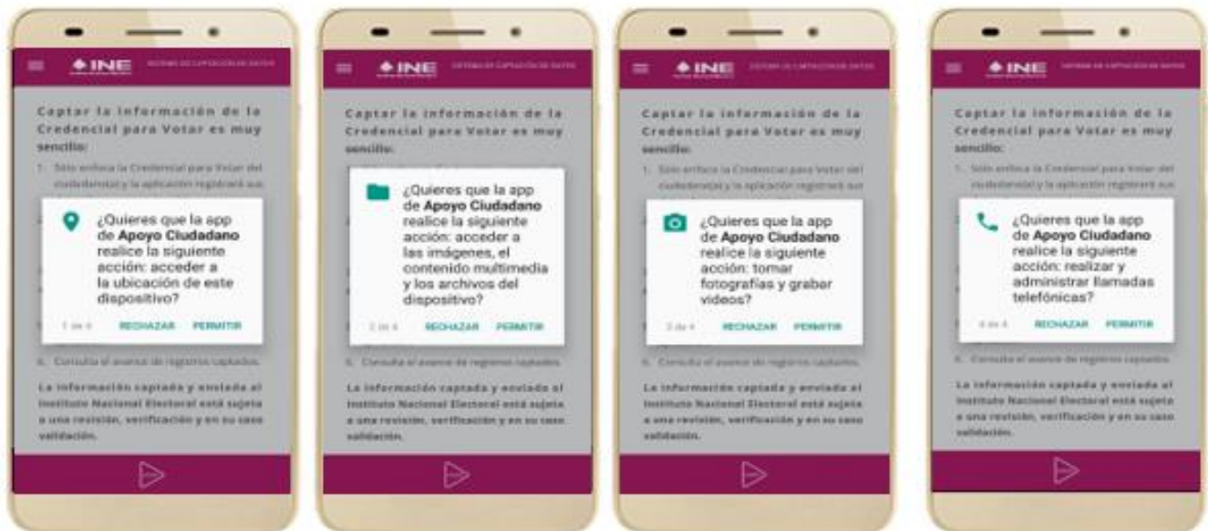
Figura 8. Mensajes de Inicio – Permisos de acceso al dispositivo.