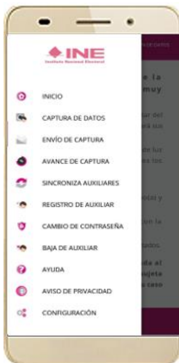
Figura 13. Pantalla de Menú desplegable.