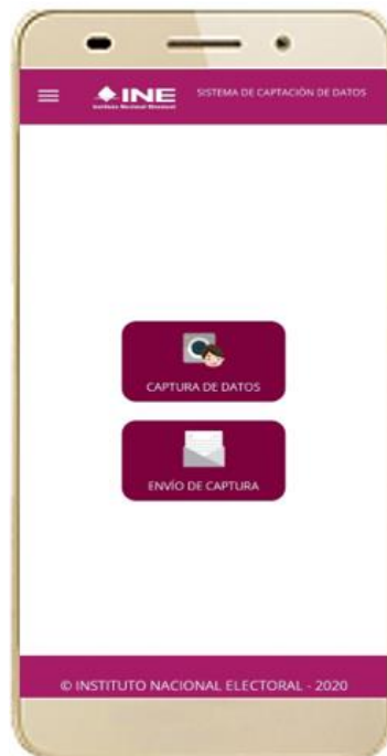
Figura 12. Pantalla de Menú principal Auxiliares.